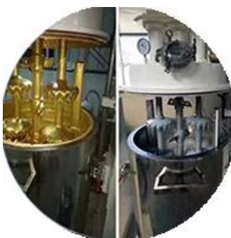
Batching production line.