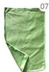
07 Scouring Pad