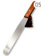
05 Stirring Knife