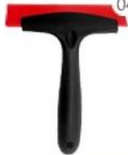
04 Rainbow Scraper