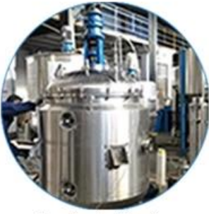
Creaming Machine Line