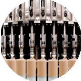
Pagpuno ng linya ng makina