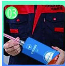
03 Buksan at panoorin, ang magkabilang panig ay maaaring extruded samantala.