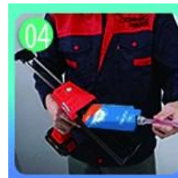
04 Tornilyo sa nozzle, ilagay sa grawt gun.