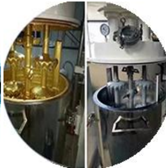
Batching production line.