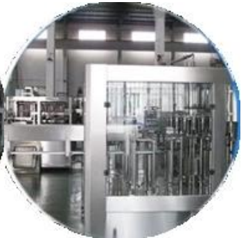
Paglamig ng pag-file