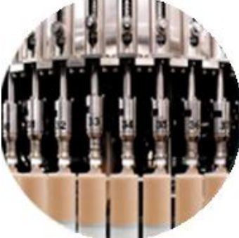
Pagpuno ng linya ng makina