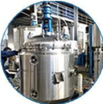
Creaming Machine Line.