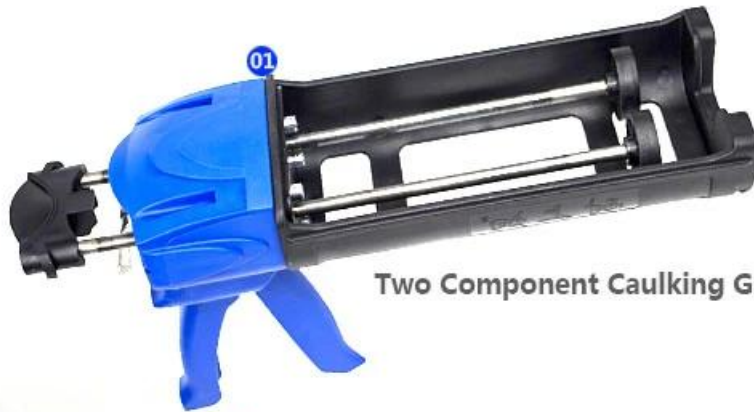
Two Component Caulking Gun