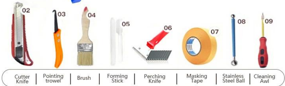
02 Cutter Knife