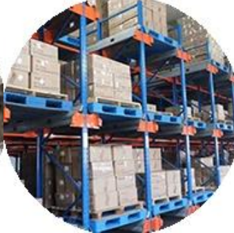
Real Material Stock.