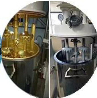
Batching production line.