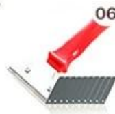
06 Perching Knife