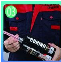
Buksan at panoorin, ang magkabilang panig ay maaaring extruded samantala.