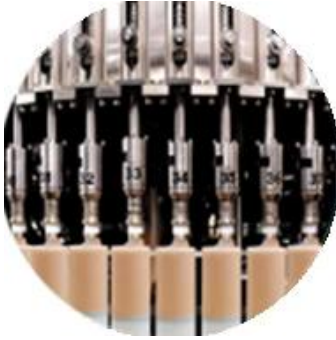
Pagpuno ng linya ng makina