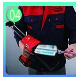
04 Tornilyo sa nozzle, ilagay sa grawt gun.