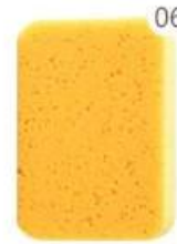
06 The sponge