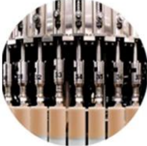
Filling Machine Line