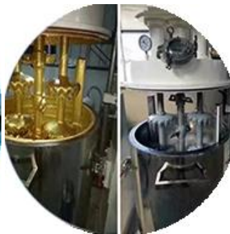
Batching production line.