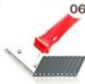
06 Perching Knife