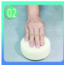
02 Polish na may tile waks maliban sa glazed tile.