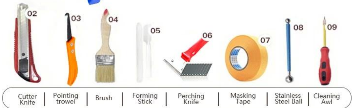
02 Cutter Knife