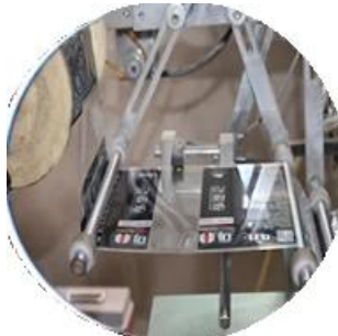
Makina na pinahiran ng pelikula