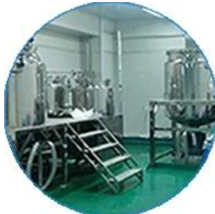
Makina sa Pagsubok