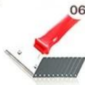
06 Perching Knife