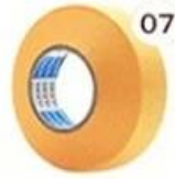
07 Masking Tape