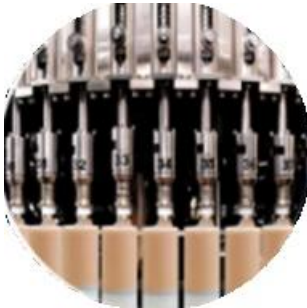
Pagpupuno ng linya ng makina