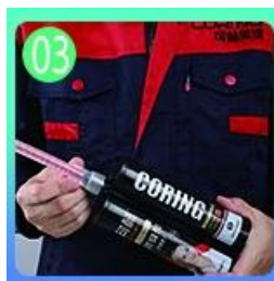
Buksan at panoorin, ang magkabilang panig ay maaaring extruded samantala.