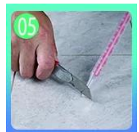
Hilig hiwa ang tuktok ng nozzle sa 45 °.