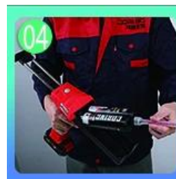
Tornilyo sa nozzle, ilagay sa grawt gun.