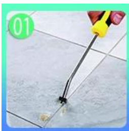
Linisin ang mga tile at panatilihing tuyo ito.