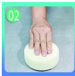
Polish na may tile waks maliban sa glazed tile.