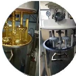
Batching production line.