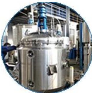
Creaming Machine Line.