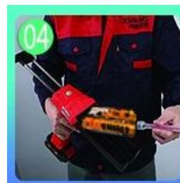
Tornilyo sa nozzle, ilagay sa grawt gun.