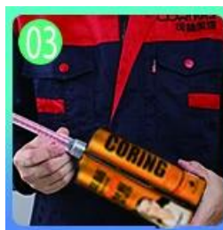
Buksan at panoorin, ang magkabilang panig ay maaaring extruded samantala.