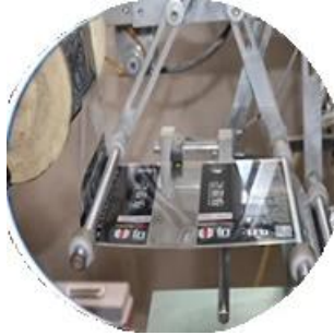
Makina na pinahiran ng pelikula