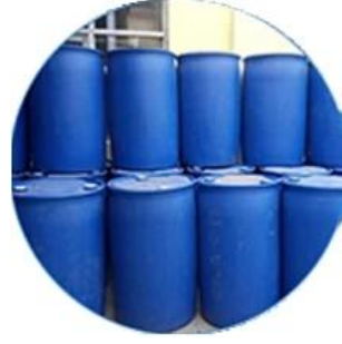
Real Material Stock.