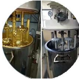
Batching production line.