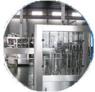
Paglami ng pag-file