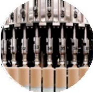
Pagpuno ng linya ng makina