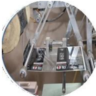
Makina na pinahiran ng pelikula