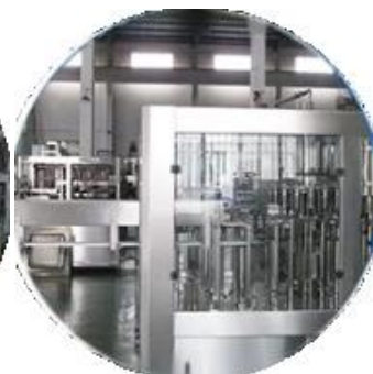
Paglamig ng pag-file