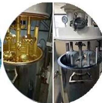
Batching production line.