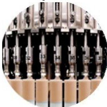
Pagpuno ng linya ng makina