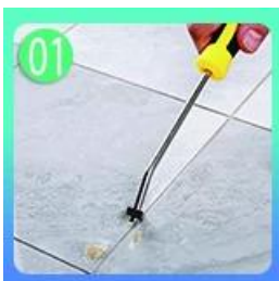
01 Linisin ang mga tile at panatilihing tuyo ito.