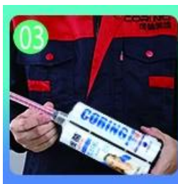
03 Buksan at panoorin, ang magkabilang panig ay maaaring extruded samantala.